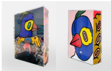
外星人的真相 2021 塑膠彩・木箱・亞加力外殼 尺寸：32.4 x 22.3 x 7.3cm HK$12,000