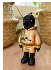
Baby Parrotman 2021 寶麗石粉樹脂（30 版次） 高度：12cm HK$1,100