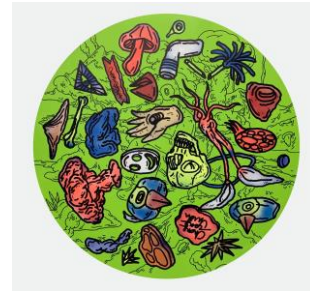
考古工具 2021 塑膠彩・帆布 尺寸：120 x 120 x 5cm HK$108,000