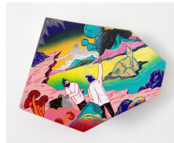
發現起源地 2021 塑膠彩・多邊木塊 尺寸：60 x 46 x 16cm HK$38,000