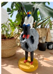
鸚鵡人與太湖石君 2021 亞加力・樟木 尺寸：37 x 14.5 x 14.5cm HK$16,600